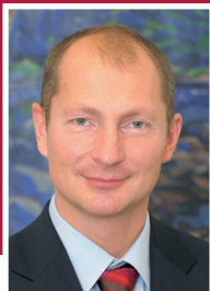
MUDr. Petr Zimmermann Hejtman Plzeňského kraje

Jsem rád, že můžu být svědkem dlouholetého úspěšného fungování jednoho z přeshraničních projektů, který vznikl na základě úzkých vztahů mezi Českou republikou a Spolkovou republikou Německo a který je součástí i partnerství mezi Plzeňským krajem a Vládou Horního Falcka.