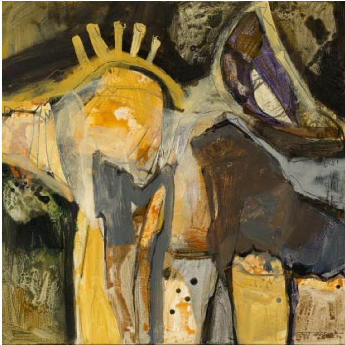
„Nacht, Gedanken“, 2005, Acryl/Leinwand, 80 x 80 cm