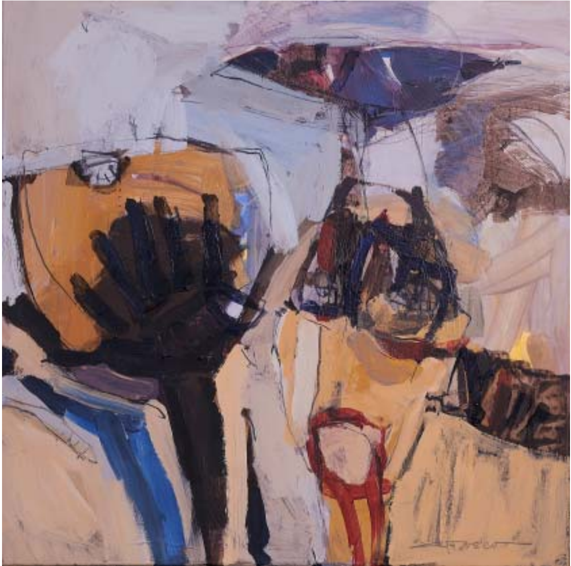
„Kopf, Vogel, Baum“, 2005, Acryl/Leinwand, 80 x 80 cm