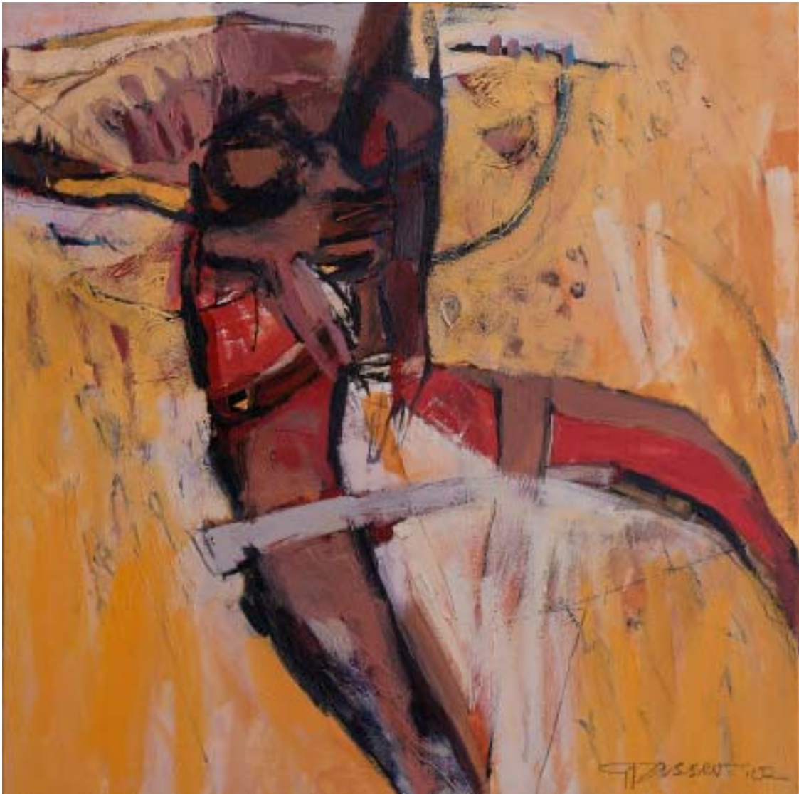
„Roggenfeld“, 2002, Öl/Leinwand, 100 x 100 cm