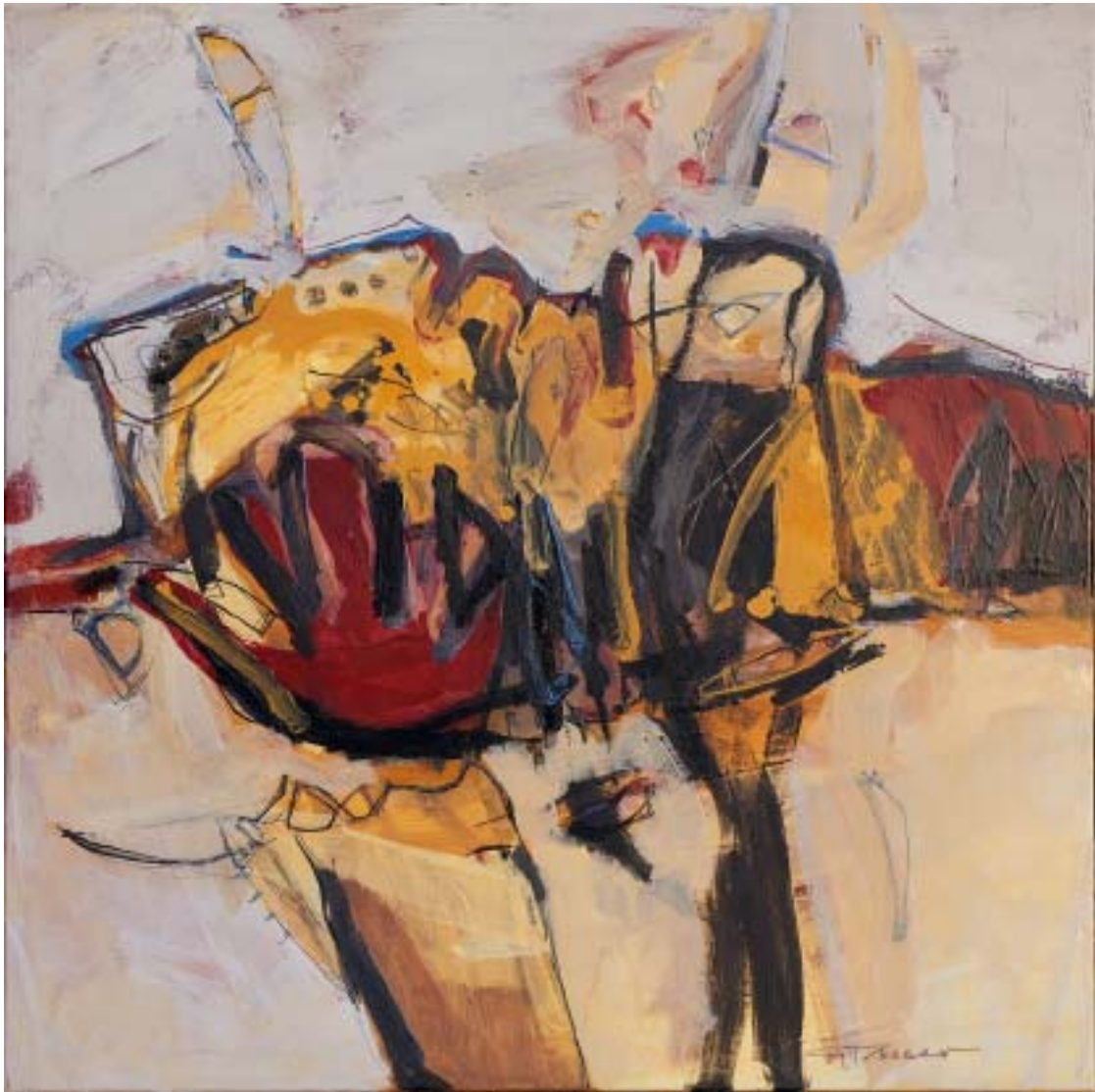
„Tag, Gedanken“, 2005, Acryl/Leinwand, 80 x 80 cm