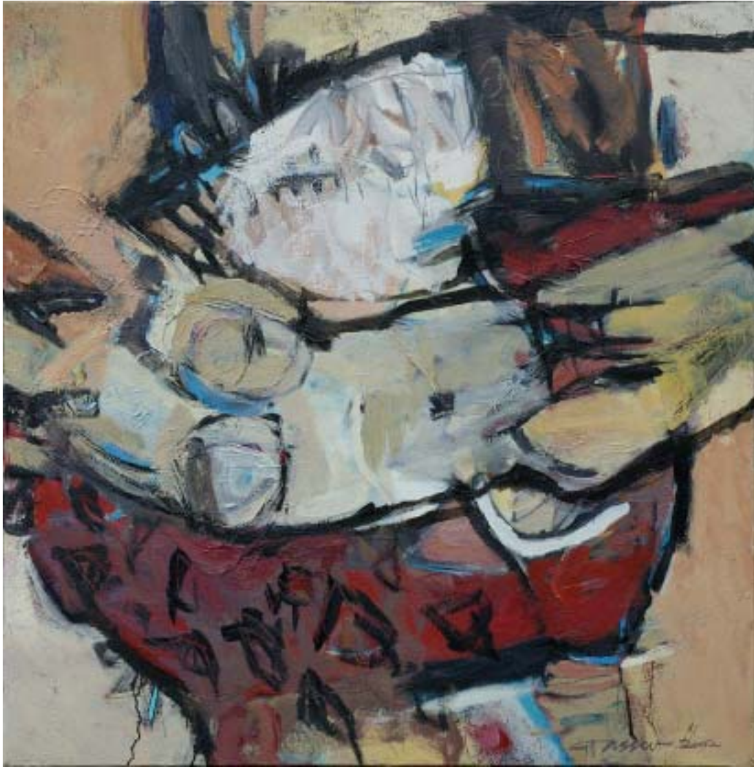
„Rotes Tuch“, 2002, Öl/Leinwand, 100 x 100 cm