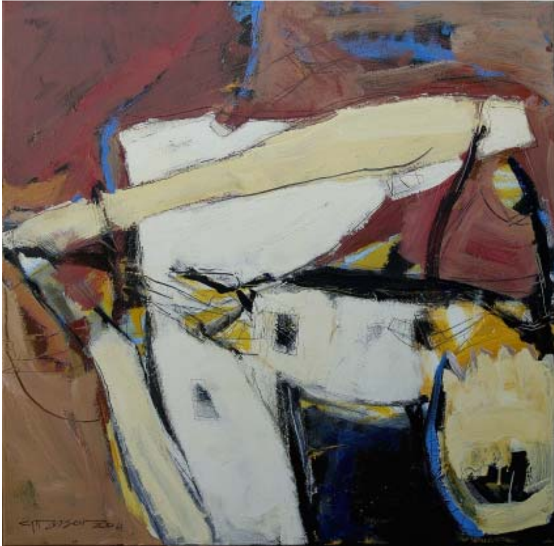
„Befindlichkeit“, 2004, Acryl/Leinwand, 80 x 80 cm