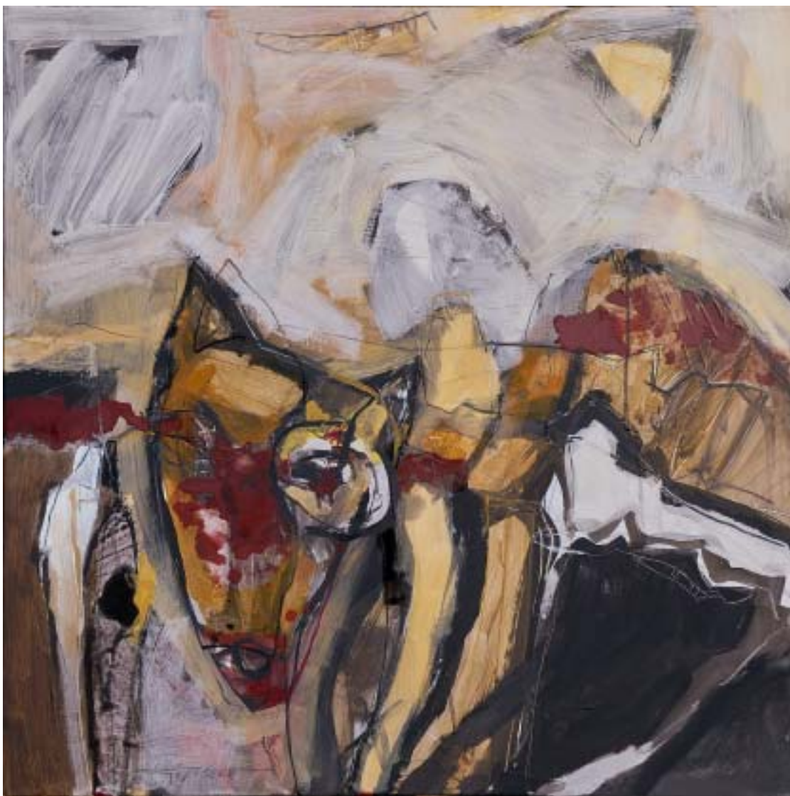
„Niedlich“, 2005, Acryl/Leinwand, 80 x 80 cm