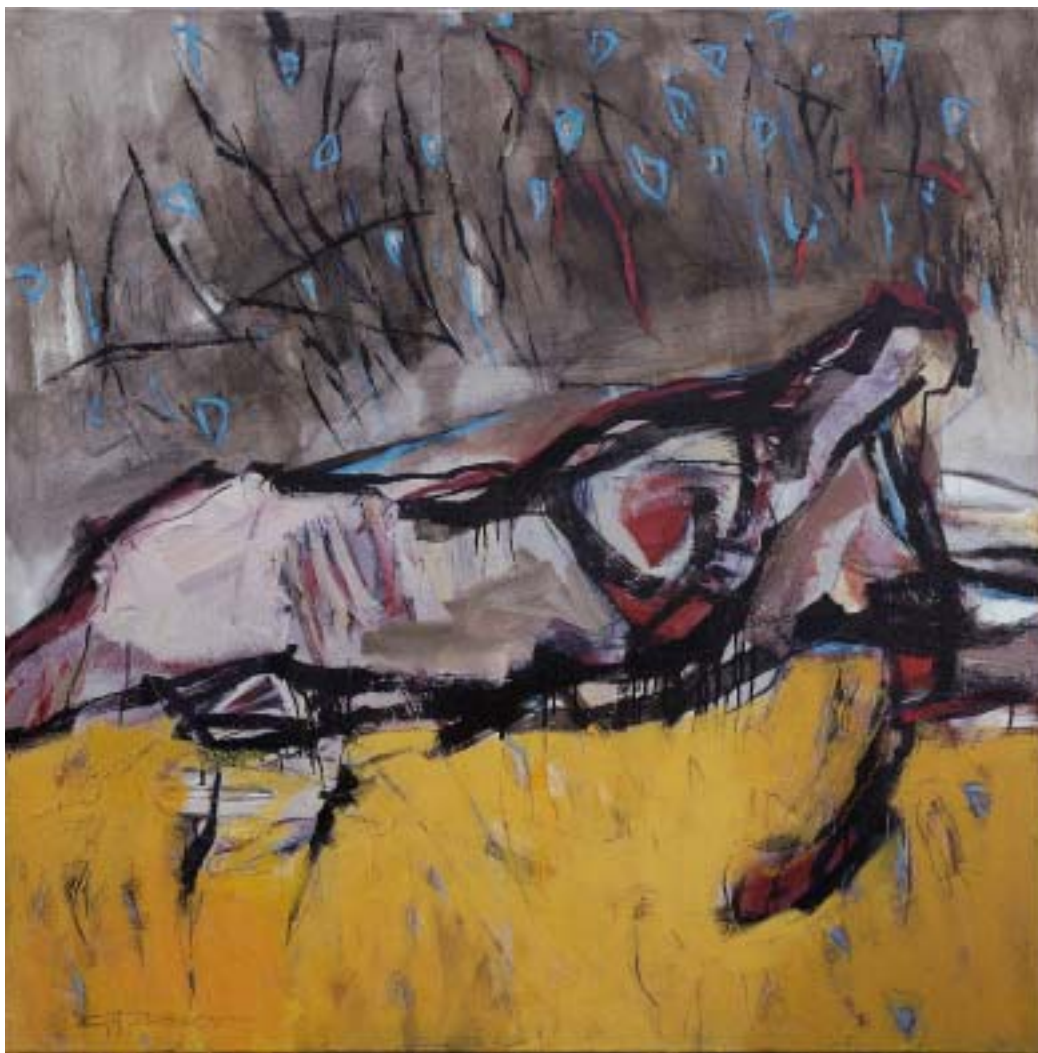
„Fixsternfall“, 2003, Öl/Leinwand, 100 x 100 cm