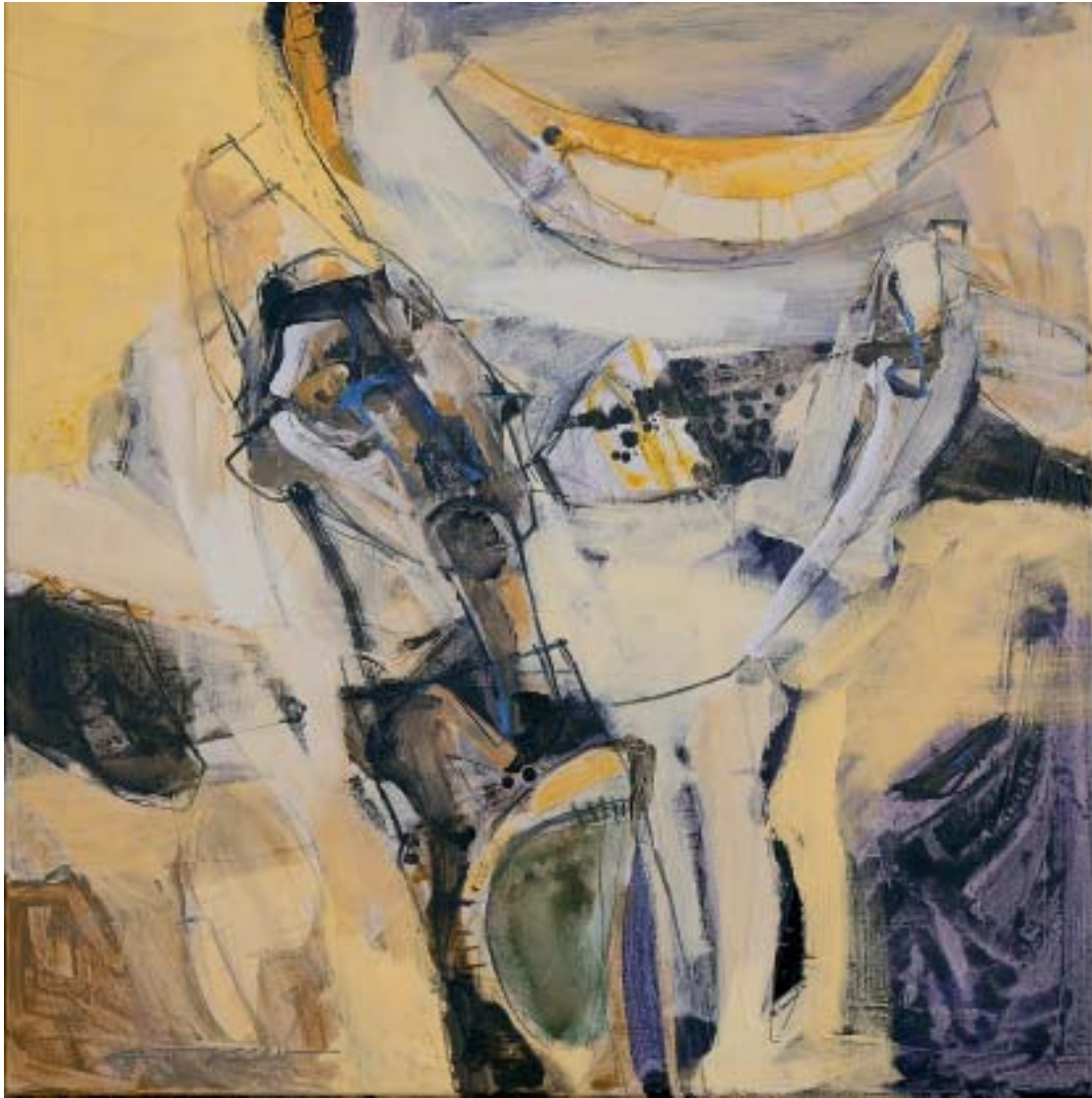
„Nicht Erreichbar“, 2005, Arcyl/Leinwand, 80 x 80 cm