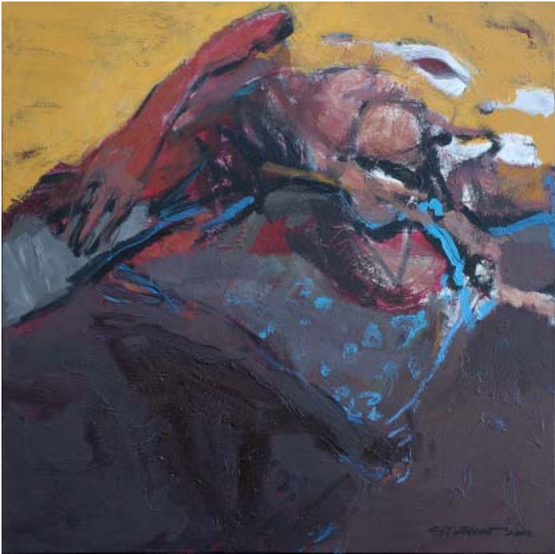
„Legend“, 2002, Öl/Leinwand, 100 x 100 cm