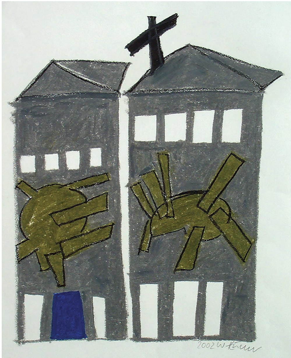
o.T., Ölpastell 2002, 44 x 34 cm