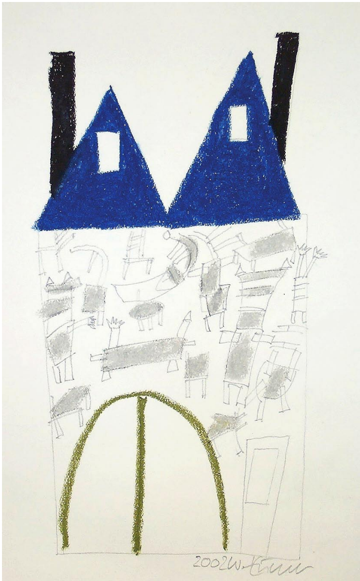
o.T., Ölpastell 2002, 38 x 21 cm