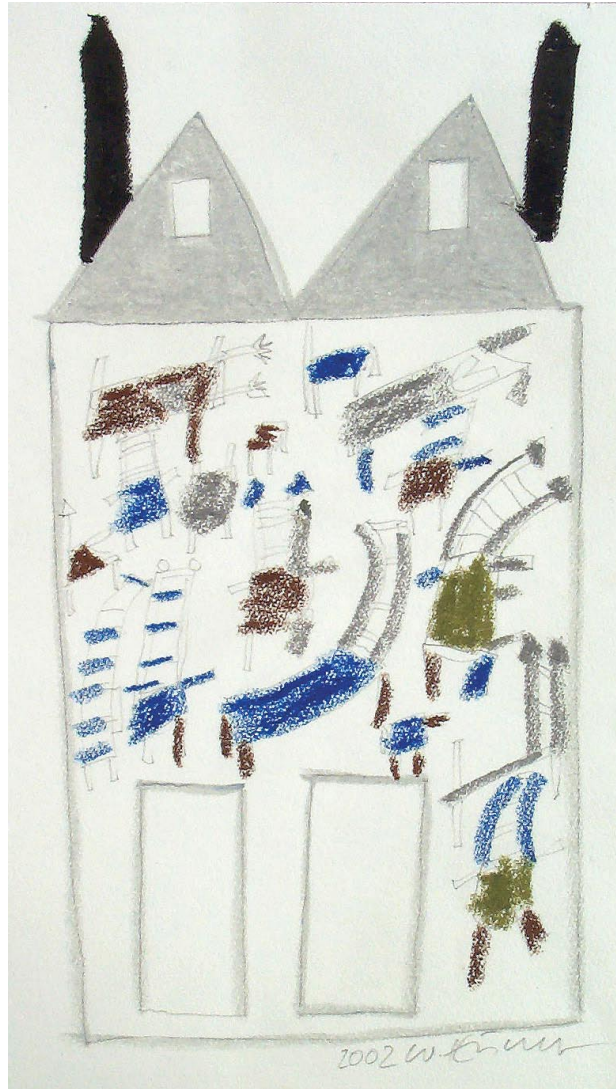
o.T., Ölpastell 2002, 38 x 21 cm