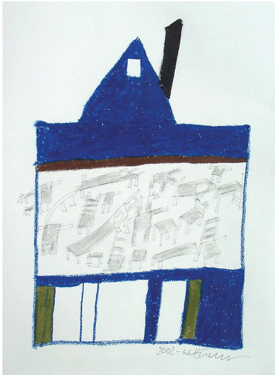
o.T., Ölpastell 2002, 35,5 x 25,5 cm