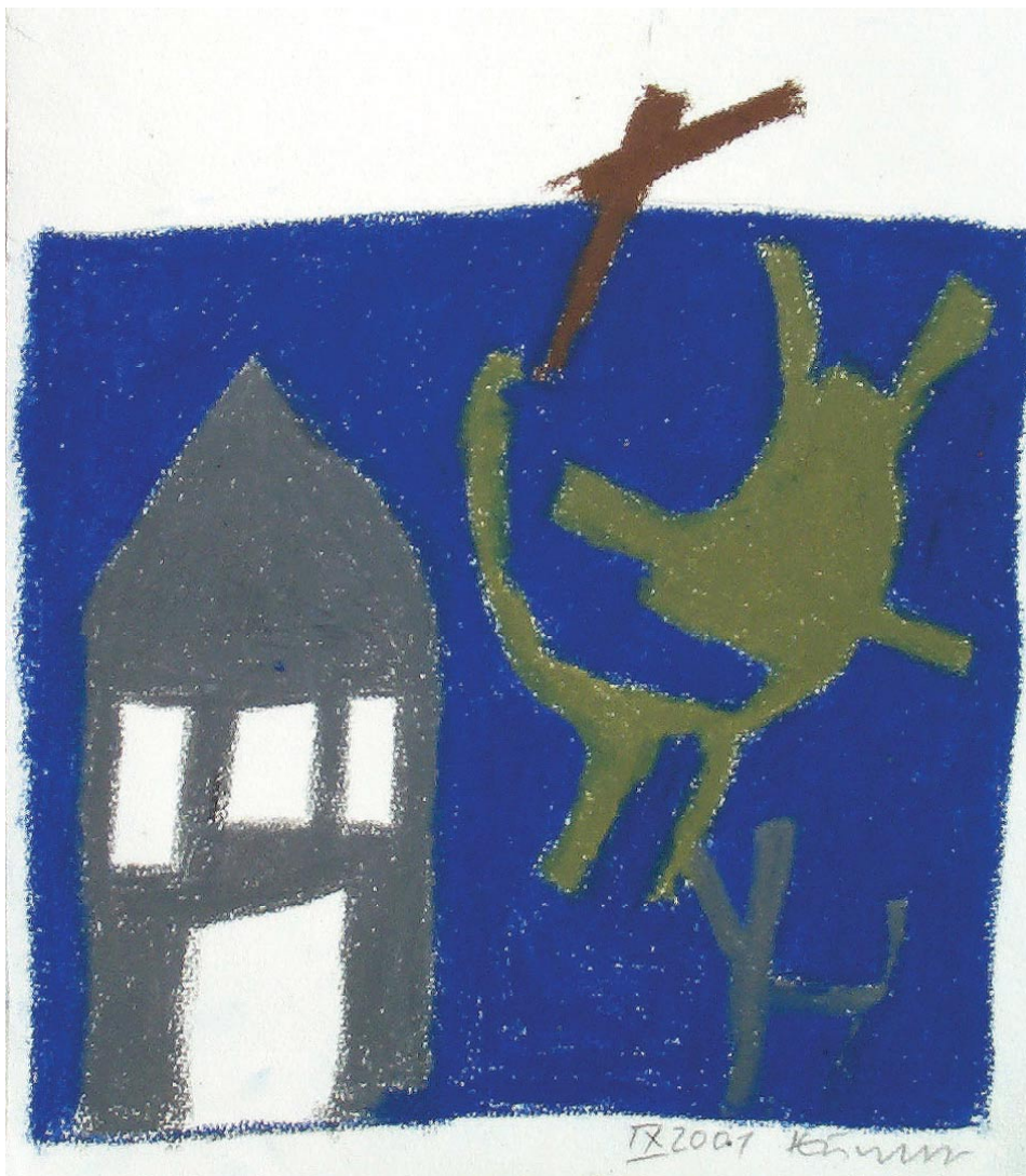
o.T., Ölpastell 2002, 31,5 x 28,5 cm