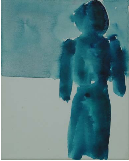
„Figur“, Aquarell auf Nessel, 30 x 23 cm, 2006