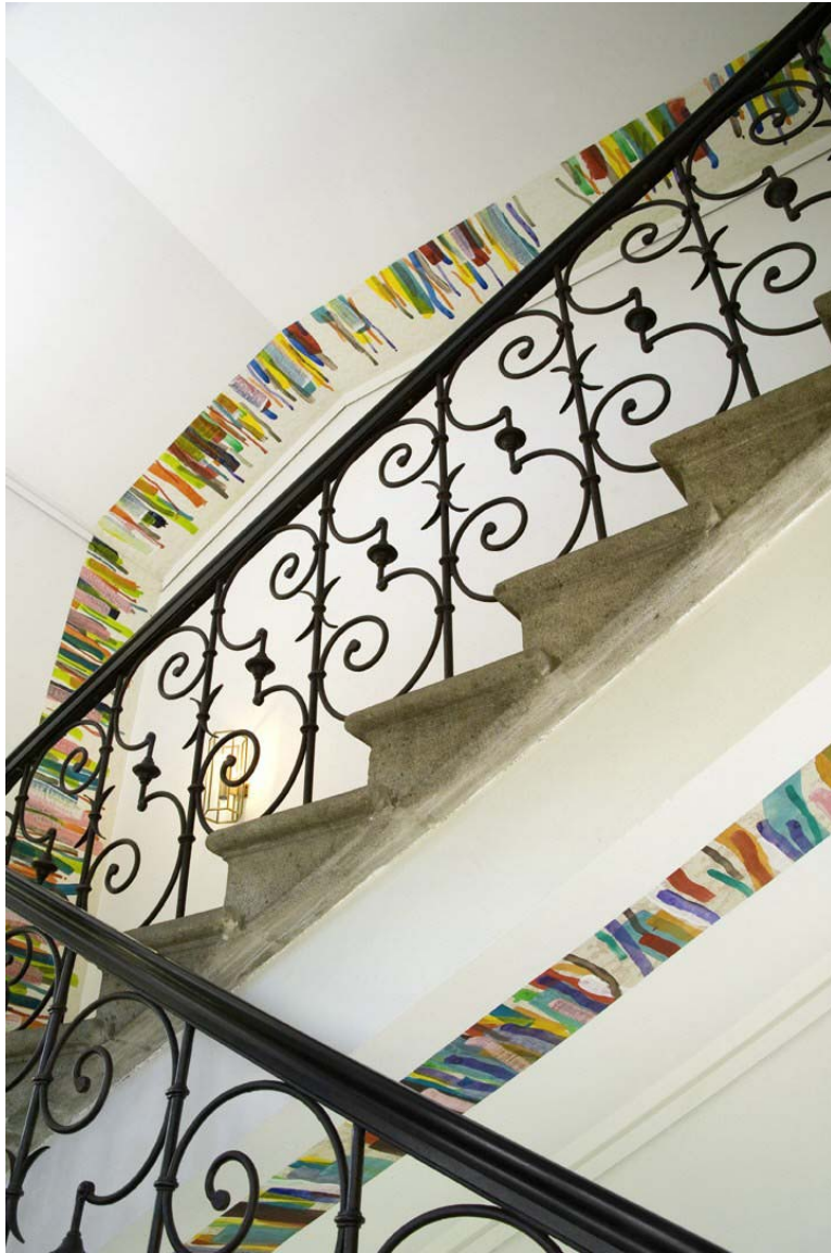
Tapezierung im Treppenhaus des Künstlerhauses Schwandorf anlässlich der Ausstellung „Furth“, 2005