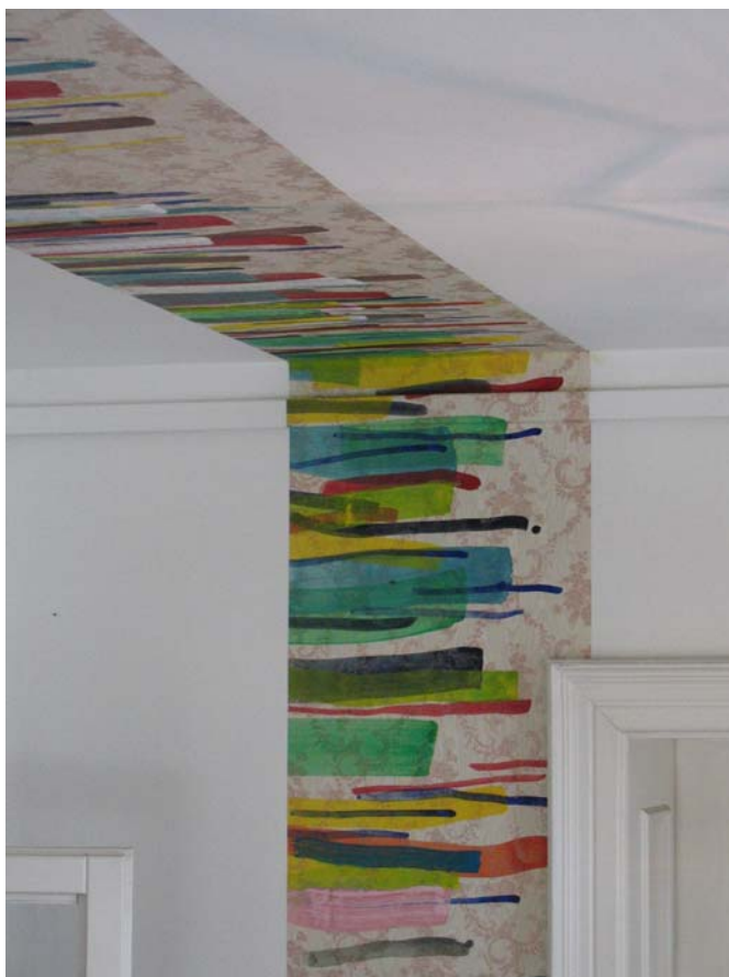
Detail: Tapezierung im Treppenhaus des Künstlerhauses Schwandorf anlässlich der Ausstellung „Furth“, 2005