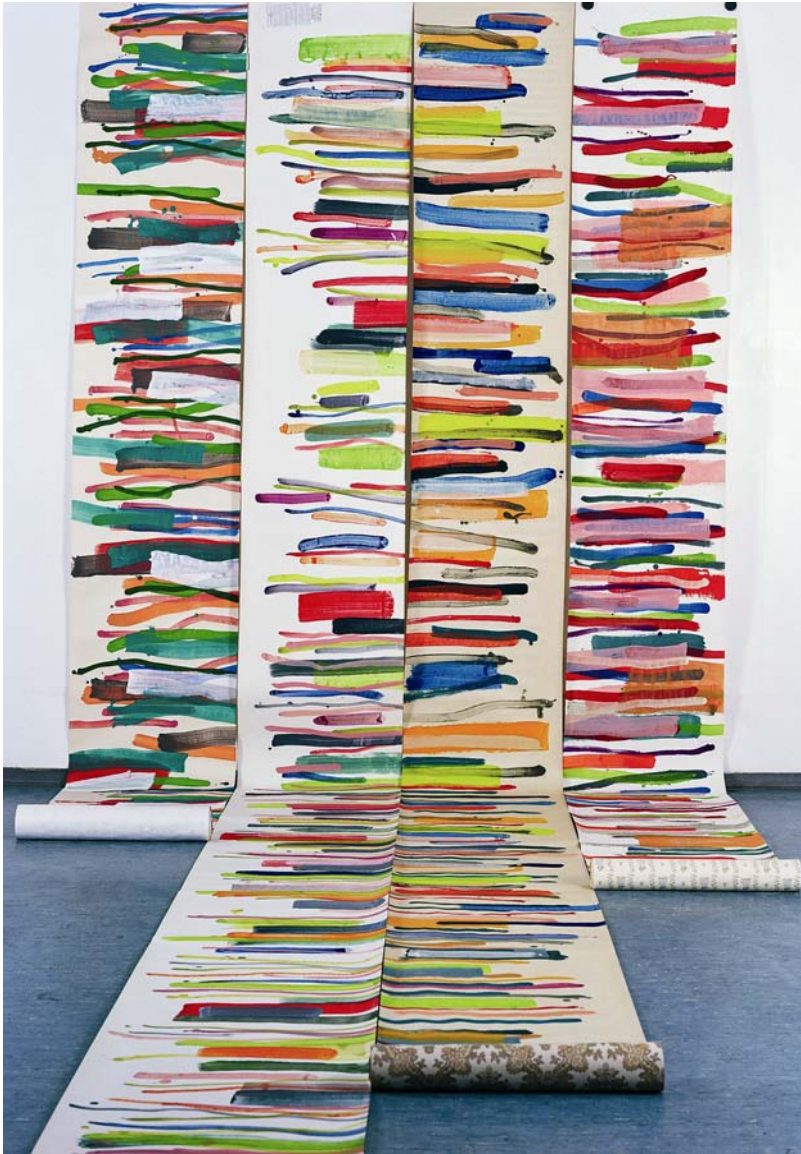
Installation mit vier Tapetenrollen, 2003, Ei-Tempera/Acryl auf Tapetenrolle, ca. 10 m x 2 m (variabel)