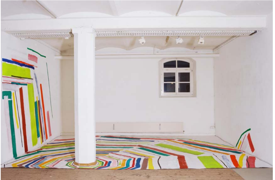
Boden-Wand-Malerei für die Ausstellung „voneinsaufzweiaufdrei“ in der Kulturwerkstatt HAUS 10, Fürstenfeldbruck, 2006