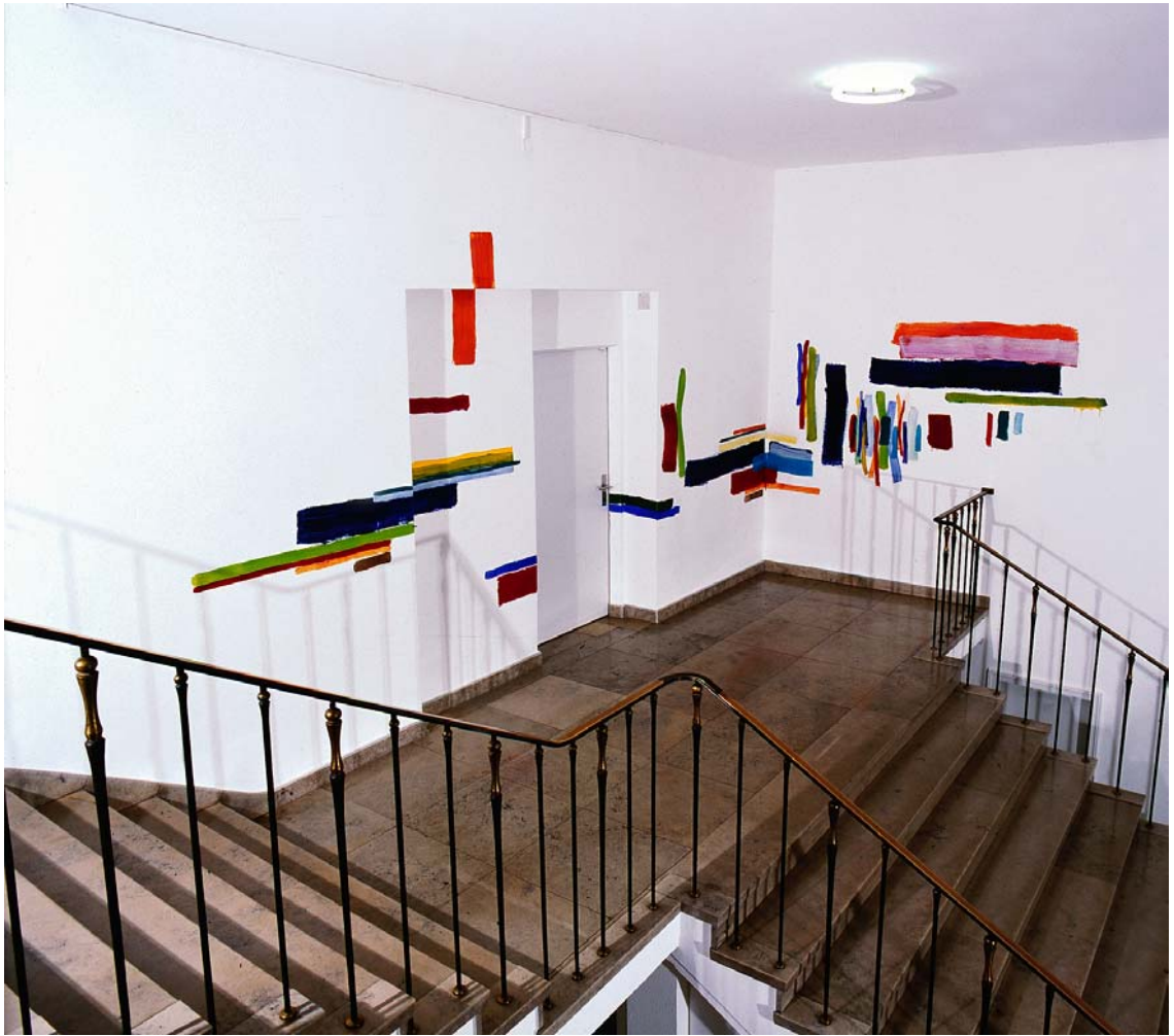
Wandmalerei „an Ecken“ im Eingangsbereich der Pfalzgalerie Kaiserslautern, 2005