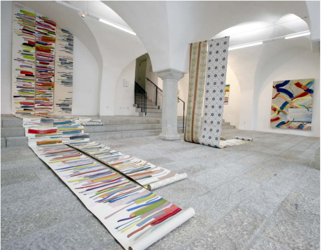
„Bilder von der Rolle“, Gesamtansicht im Skulpturenraum Museum Moderner Kunst Stiftung Wörlen, Passau, 2005