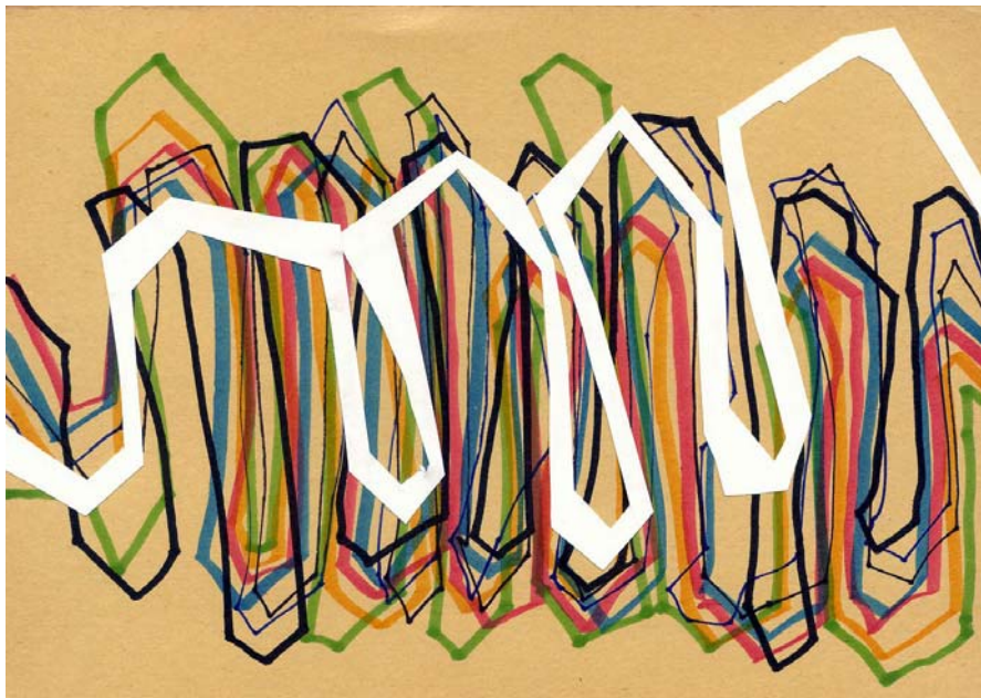
„Ornamentzeichnung“, Filzstift auf Papier, Collage, 14,5 x 21 cm, 2006