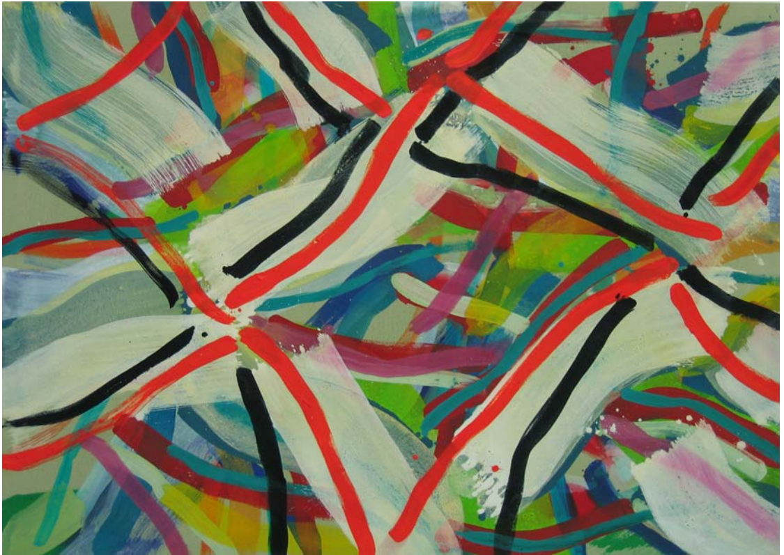
„Barockbild“, Ei-Tempera / Öl auf Nessel, 105 x 150 cm, 2005