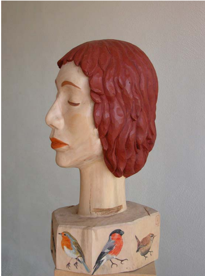
Lied, 2006, Linde, polychromiert, ca. 40 cm