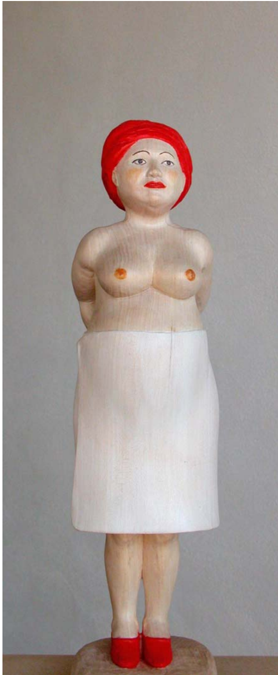
Große Gebadete, 2006, Linde polychromiert, 34 cm