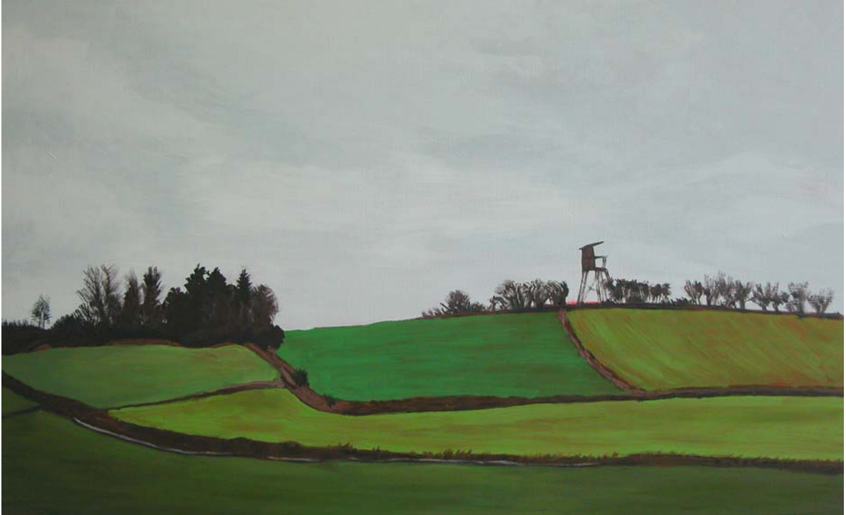
Winterfelder, 2007, Öl auf Hartfaser, 40 x 65 cm