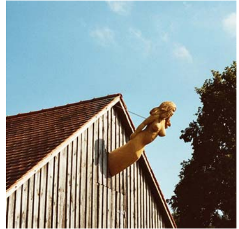
Windsbraut, 2006, Eiche, Länge ca. 200 cm, Mühlhausen, Klenzebau/Alter Kanal

2002 Grützke. Schüler., AdbK., Nürnberg Ichnusa (Beginn der Ausstellungsreihe zur Studienfahrt Sardinien, es erschien eine druckgraphische Mappe), Galerie in Zabo, Kreisingalerie Nürnberg, Stadttheater Fürth, 2003, BBK Unterfranken/Würzburg, 2004 X-Zeit, Reitstadel Neumarkt