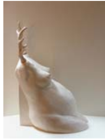
Bauch gehört, 2001 Ton, ca. 80 x 40 x 55 cm