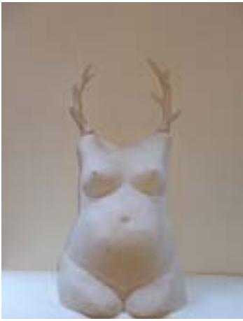
Schneewittchen und der Zwerg, 2005, Linde, polychromiert, 32 cm