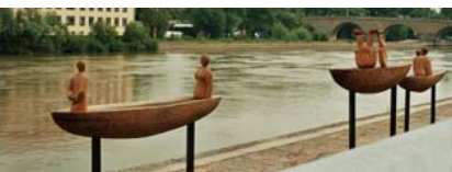
3 Boote, Eiche, temporäre Installation, Regensburg, Donau, Altstadtbereich, je ca. 200 x 200 cm