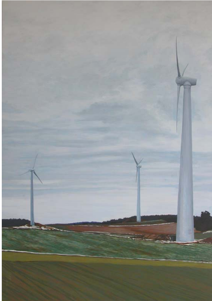
3 Windräder, 2005, Öl auf Hartfaser, 140 x 100 cm