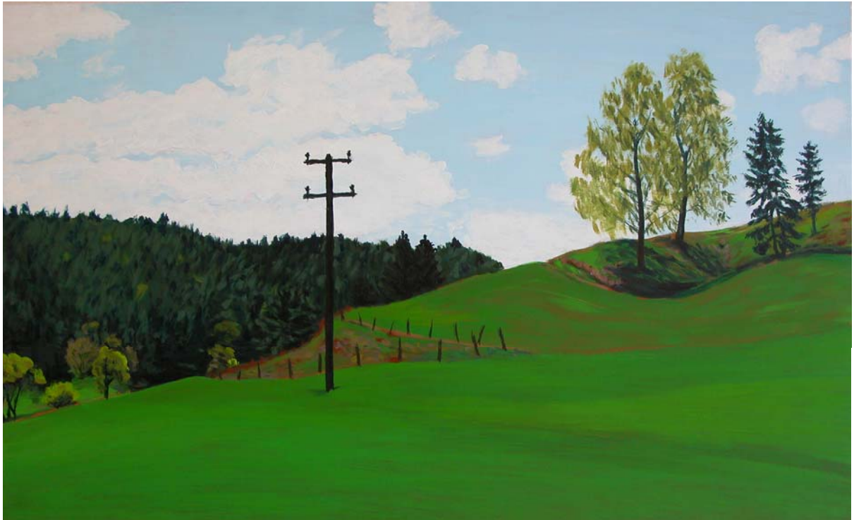
Jugenberg, 2007, Öl auf Hartfaser, 40 x 65 cm