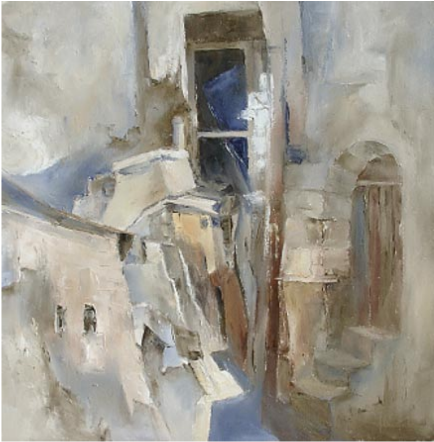
Gasse zum Abgrund: Sorano