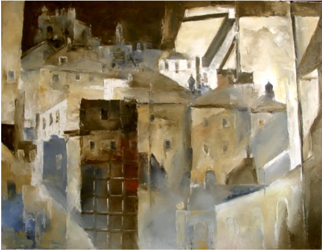
Aufstieg zur Stadt: Monte San Savino