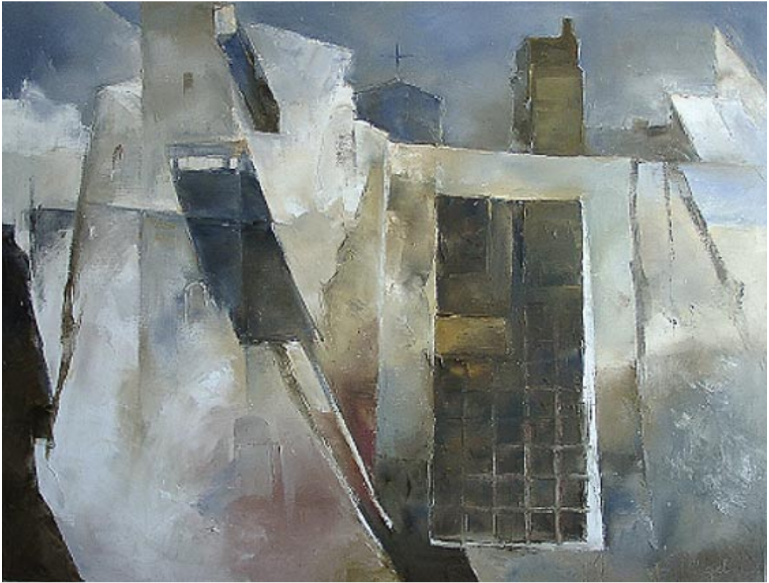
Mauern und Türme 1: San Gimignano