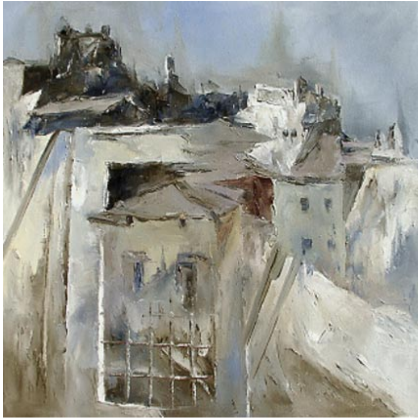
Annäherung an Monte San Savino