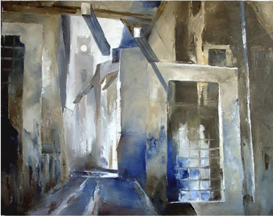
Straße ins Licht: San Quirico d' Orcia