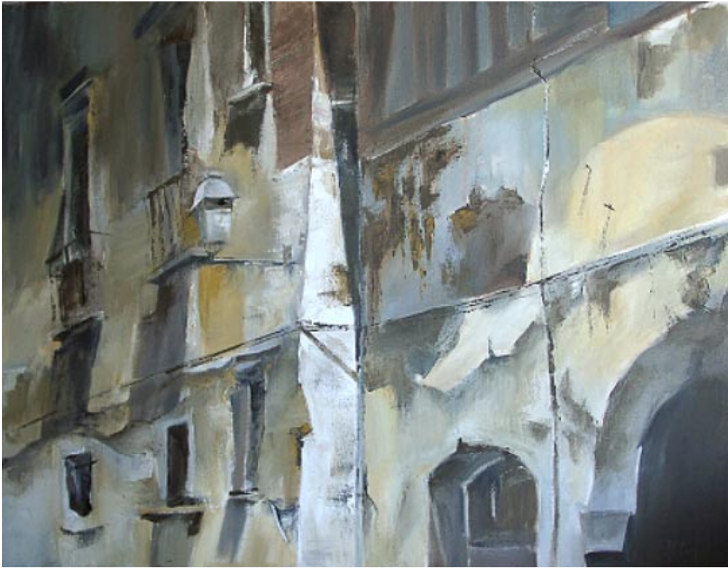
Reiz des Alters: Orvieto