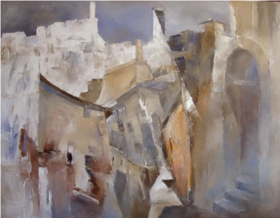
Stürzende stolze Stadt: Sorano