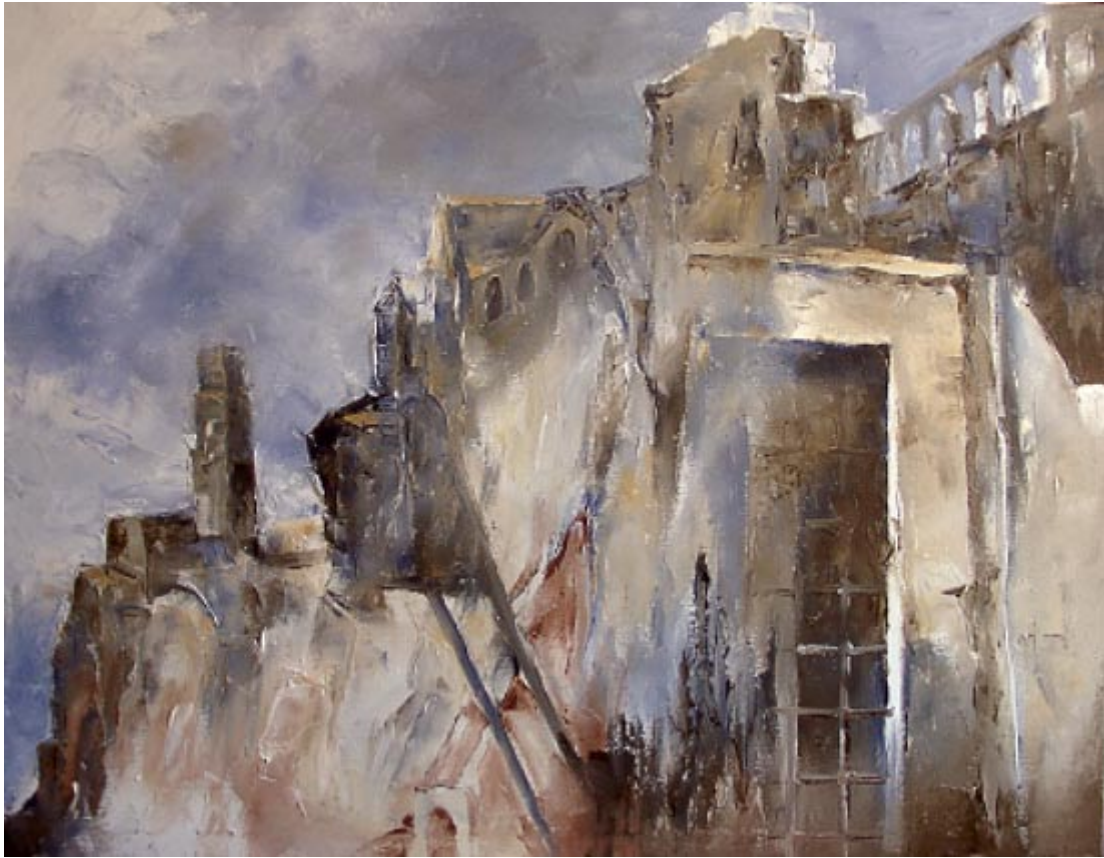
Auf hohem Fels: Pitigliano