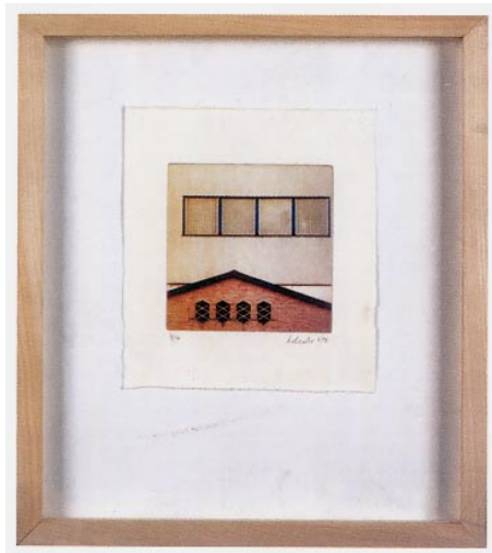
"Südzucker", 1998, Heliogravüre, 3-farbig, 15 x 15 cm

Die Anwendung des gleichen Prinzips in der Umkehrung kann man in der neuerlichen Unternehmung von Alois Achatz sehen, Kuben, große "naturrostige" Stahlwürfel in der Landschaft zu platzieren, sie so kontrastierend zu akzentuieren. Der Anwendungsmöglichkeiten dieses Gegensatzprinzips sind viele - es läuft auf die gleiche Melodie hinaus: hier die anschauungsfreudige Dinglichkeit, dort die "anatomische" (das heißt wörtlich "aufgeschnittene" also präparierte) Kühle, Leben und Geometrie, oder, wenn man so weit denken will, Daseinslust und memento mori.