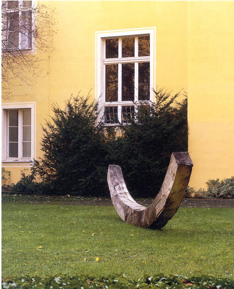
„Kleiner Bogen“, 1999, Pappel 80 x 30 x 500 cm