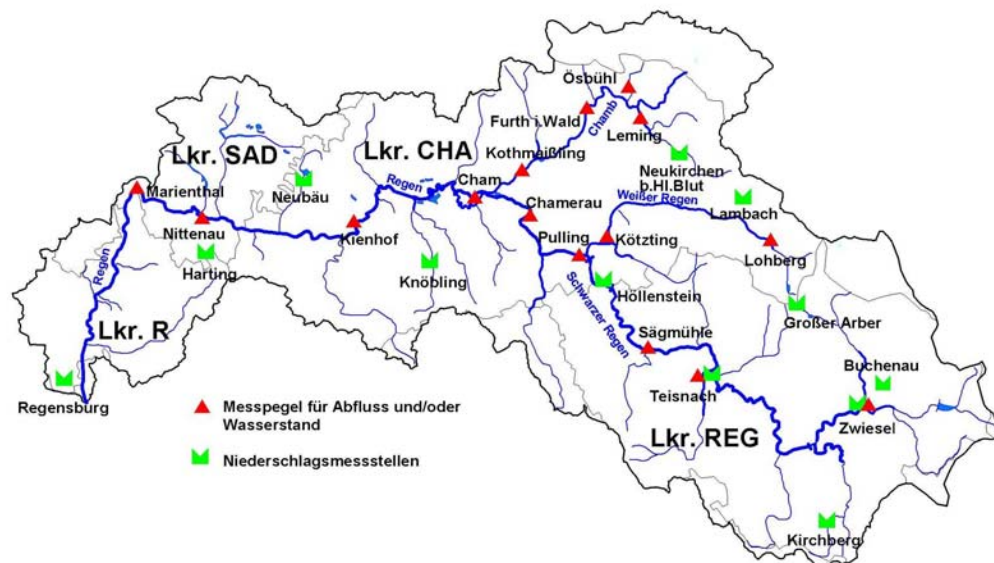
Messeinrichtungen für Niederschlag, Abfluss und Wasserstand zur Hochwasservorhersage im Einzugsgebiet des Regens

Regierungen der Oberpfalz und von Niederbayern