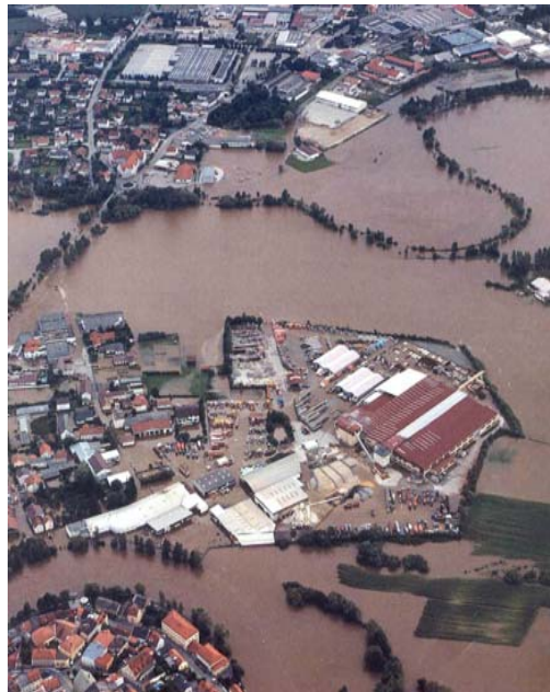
„Jahrhunderthochwasser“ am Regen im August 2002